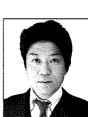
伊藤俊彦 (ルースベルト大執領)