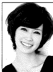
辺見えみり (ハニガン)